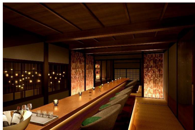
レセプション棟二階 バー・ラウンジイメージ ※「バー」利用時間：13時～23時（予定）