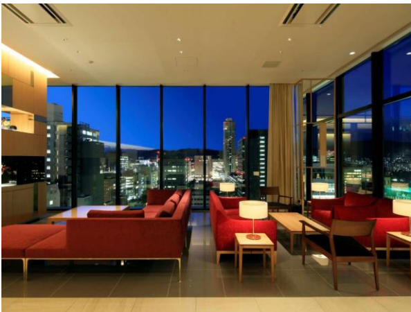
カンデオホテルズ広島八丁堀

八丁堀駅から徒歩約2分、広島駅からもタクシーで約5分に位置し、ビジネスの拠点としてはもちろん、原爆ドームや広島平和記念公園も徒歩圏内で観光にも便利な立地です。天空のスパでは星空に一番近い露天風呂とサウナで、都心とは思えない非日常的な開放感を味わいながら心と体をリラックスしてお過ごしいただけます。