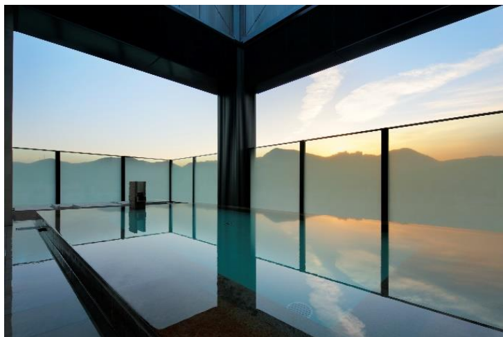
カンデオホテルズ長崎新地中華街

新型コロナウイルスの感染拡大により、「遠出はしづらいが、自宅以外の場所で非日常を味わいたい」と考える人々の間で、ホテルに籠って思い思いの時間を過ごす「おこもりステイ」のニーズが増加しています。また、ホテルでテレワークをするお客様も増えていることからホテルステイの様々なニーズに応え、より自由にゆったりとお過ごし頂けるプランを開発しました。