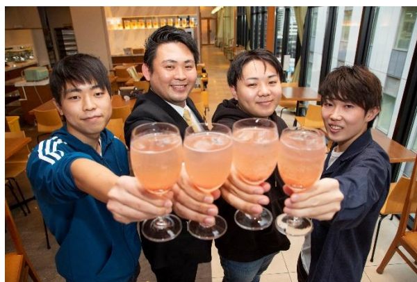
福岡大学サウナサークルのメンバーと カンデオホテルズ福岡天神店舗責任者

この度、カンデオホテルズ福岡天神でビジター利用プランを開始するにあたり、サウナご利用後に従来よりもいっそう「ととのう」実感を味わっていただくため、福岡大学サウナサークルとスペシャルご当地ドリンク「ととのっー！ 塩あまサウダー」を共同開発し、販売します。