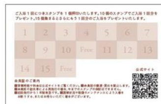
スタンプカードイメージ

URL： https://www.candehotels.com/ja/offers/20211119_1126furonohi/