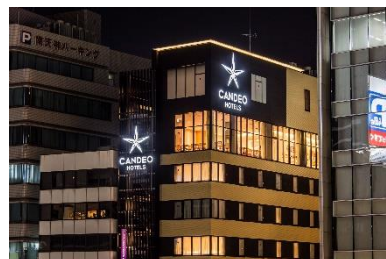
カンデオホテルズ福岡天神