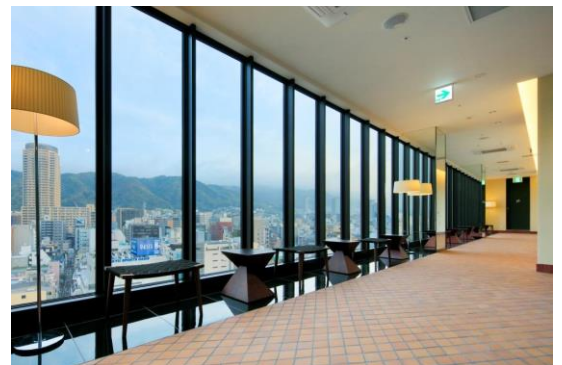
カンデオホテルズ神戸トアロード ラウンジ