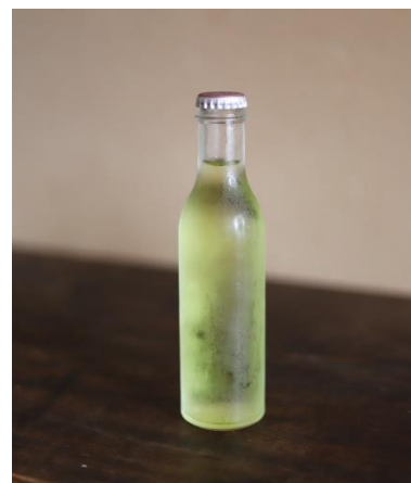
神戸・長田生まれのご当地ドリンク「アップル」

「アップル」は1952年創業の老舗飲料メーカー・兵庫鉾泉所が製造する「神戸でしか飲めない」神戸っ子なら誰もが知るご当地ドリンクです。レトロなターナブル瓶に詰まった鮮やかな黄色い液体は「アップル」というネーミングながら、爽やかなみかんフレーバー。優しい甘さが昭和の懐