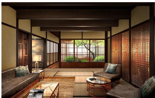
レセプション棟1階 応接の間イメージ

当ホテルは、JR 京都駅からもアクセス抜群で京都の中心地である烏丸御池駅からも徒歩3分に位置しており、主要観光スポット巡りの拠点に最適な立地に誕生します。レセプション棟、客室棟、大浴場棟の3つの棟で構成されており、お客様が京町家の空間及び文化価値を体験していただけるように京都市指定・登録文化財である旧伴家住宅（※）を改修しました。レセプション棟2階のラウンジ・バーは畳空間をそのまま残し、京町家を感じながらくつろげる空間を、また、レセプション棟1階の応接の間ではお客様が、それぞれの時間を楽しむことができる空間を作り、町家に住む感覚を体験することができます。