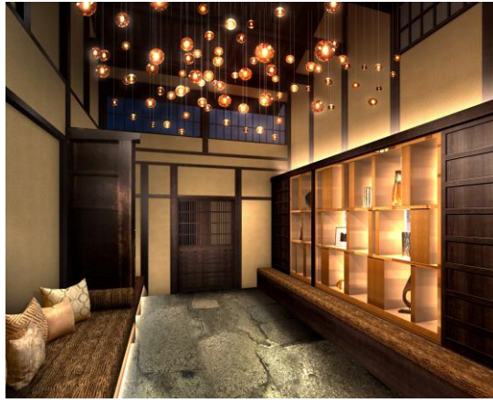
レセプション棟 通り土間イメージ