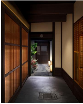
レセプション棟 通り土間イメージ